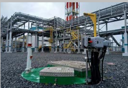
Производство и поставка 30-и комплектных КНС ПАО "СИБУР Холдинг" Западно- Сибирский Нефтехимический комбинат Г. Тобольск