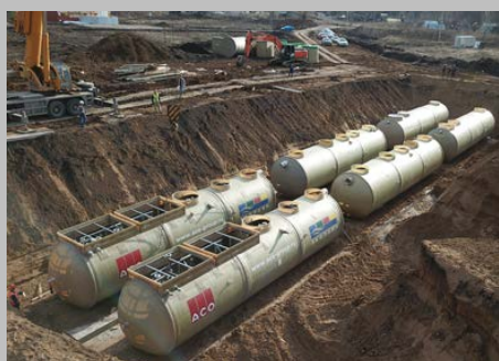
КОС ЭКО-Р-1000, ЖК "Цветы Башкирии", г. Уфа