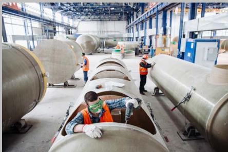
Производство г. Тольятти