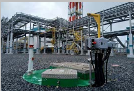
Производство и поставка 30-и комплектных КНС ПАО "СИБУР Холдинг" Западно- Сибирский Нефтехимический комбинат Г. Тобольск