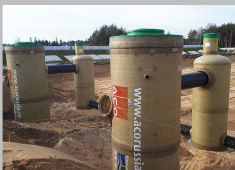
Индустриальный парк "Великий камень" "Оборудование для очистки поверхностного стока в составе ЛОС накопительного типа с самым большим в мире безбетонным аккумулярующим резервуаром АСО StormBrixx, Минск, Республика Беларусь