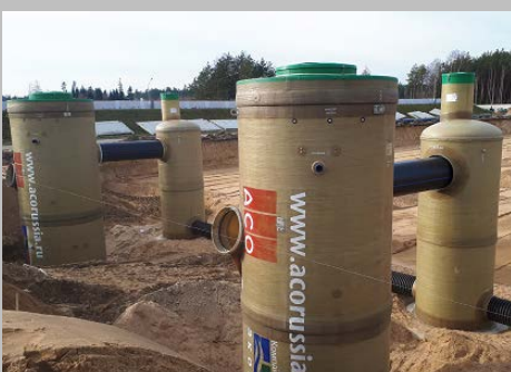
Индустриальный парк "Великий камень" "Оборудование для очистки поверхностного стока в составе ЛОС накопительного типа с самым большим в мире безбетонным аккумулирующим резервуаром АСО StormBrixx, Минск, Республика Беларусь