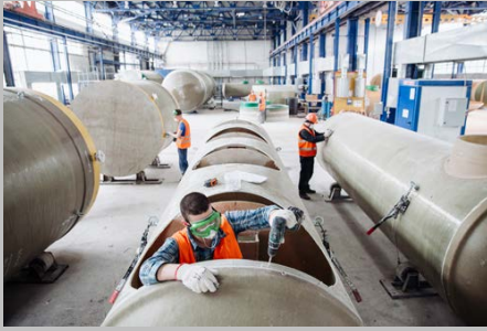
Производство г. Тольятти