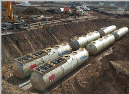
КОС ЭКО-Р-1000, ЖК "Цветы Башкирии", г. Уфа