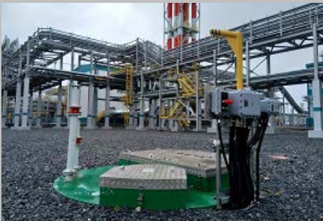
Производство и поставка 30-и комплектных КНС ПАО "СИБУР Холдинг" Западно- Сибирский Нефтехимический комбинат Г. Тобольск