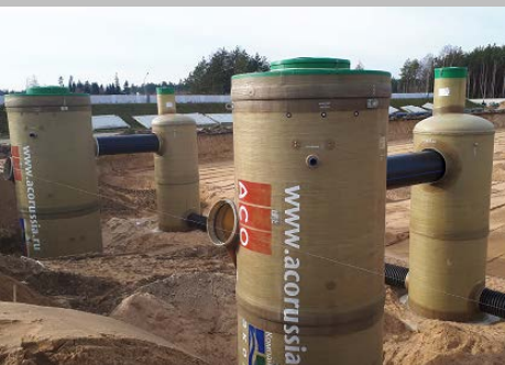
Индустриальный парк "Великий камень" "Оборудование для очистки поверхностного стока в составе ЛОС накопительного типа с самым большим в мире безбетонным аккумулярующим резервуаром АСО StormBrixx, Минск, Республика Беларусь